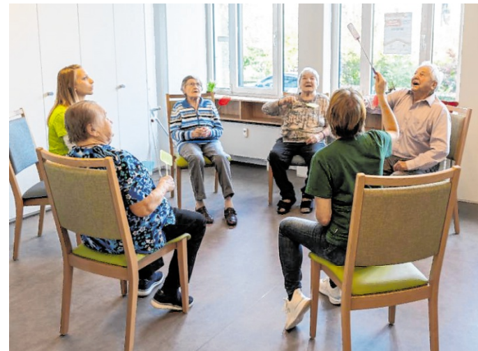
Im Therapieraum wird gezielt die Bewegung gefördert.

Gerne kann man außerdem in die Friedrichstraße kommen, die Tagespflege anschauen und bei einem Nachmittagskaffee die Einrichtung kennenlernen .