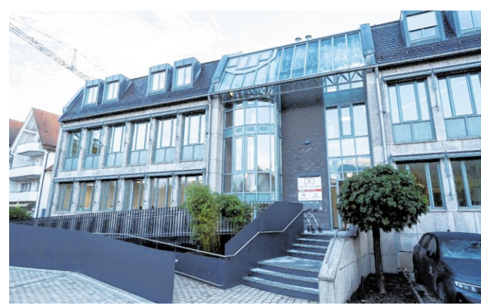
Die neue Tagespflege befindet sich in der Friedrichstraße am Stadtgarten in Osterburken.

Müssen die Pflegegäste gebracht beziehungsweise abgeholt werden? Nicht unbedingt, denn es gibt einen Fahrservice. Die Gäste werden morgens zu Hause