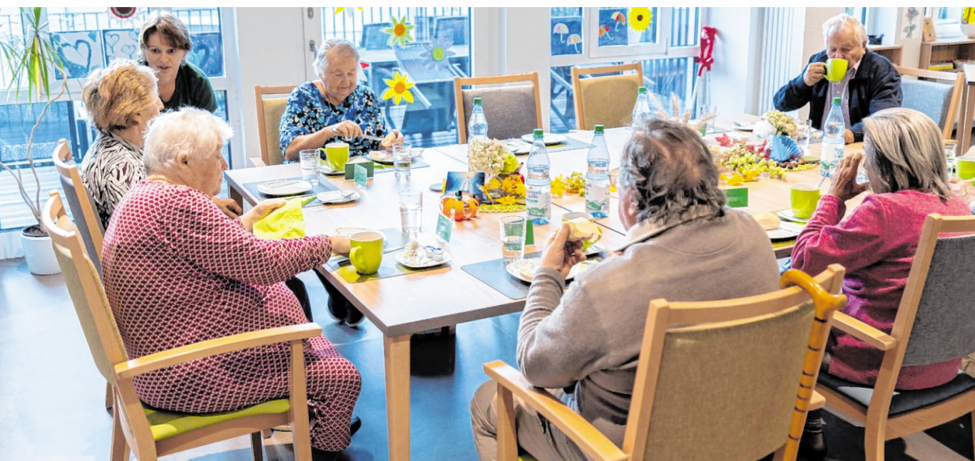
Mal rauskommen: Tagespflege-Einrichtungen ermöglichen Pflegebedürftigen tagsüber einen „Tapetenwechsel“ und das Zusammensein mit andere Menschen.

Osterburken. Die Kirchliche Sozialstation Adelsheim-Osterburken hat seit Sommer 2024 ein Tagespflege-Angebot im Programm. Betreuungsbedürftige Menschen können dort den Tag in Gesellschaft verbringen. Am Sonntag, 20. Oktober, ist Tag der offenen Tür, an dem sich Interessierte ein Bild von der neuen Tagespflege machen können.