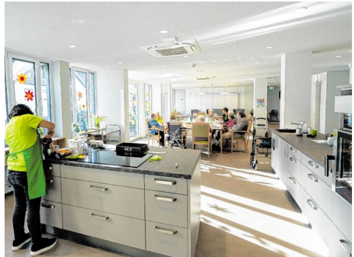
In der großen offenen Küche wird auch schonmal gemeinsam gekocht.

Am Haus werden Parkplätze für die Fahrzeuge der Befördernde der Tagespflege, für Kooperationspartner und Tagespflegebesucher zur Verfügung stehen.